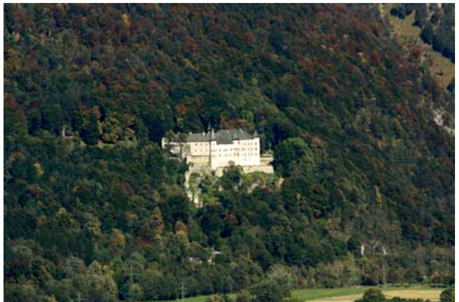
Fig. 2. Tratzberg castle, Jenbach, Tyrol, is located on a steep hill about 100 m above the bottom of the valley.

Neben diesen meist in großer Anzahl produzierten und daher häufig vorliegenden Kacheltypen treten auch – allerdings in weitaus geringerer Zahl – Kacheltypen anderer Art auf: die Nischenkacheln. Grundlegendes Unterscheidungsmerkmal ist die vertikale Drehachse des Rumpfes. Im Gegensatz zu den Blattkacheln besteht der Rumpf einer Nischenkachel aus einem mehr oder weniger halbierten Zylinder und einem vorgesetzten, durchbrochenen Blatt. Die Herstellungsweise auf der Töpferscheibe ist meist sehr gut an den Drehrillen auf der Oberfläche des Kachelrumpfes abzuleiten.