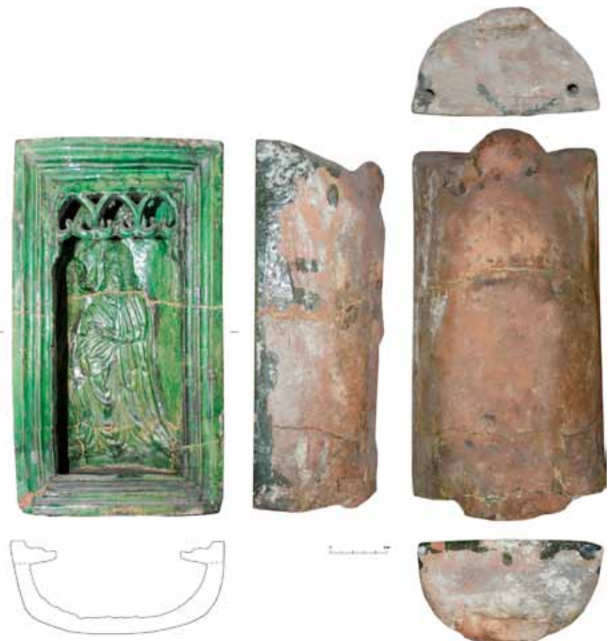
Abb. 4. Die Nischenkacheln mit Motiv 2 – Moses.