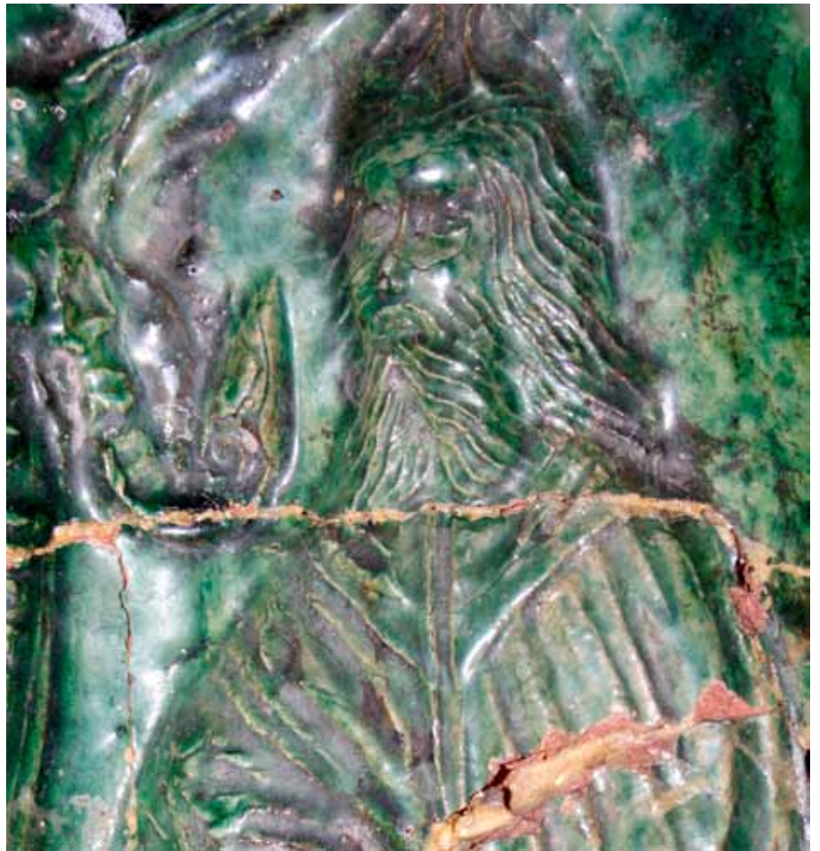
Abb. 5. Die Detailaufnahme von Motiv 2 zeigt den Torso der Figur aus Motiv 2.