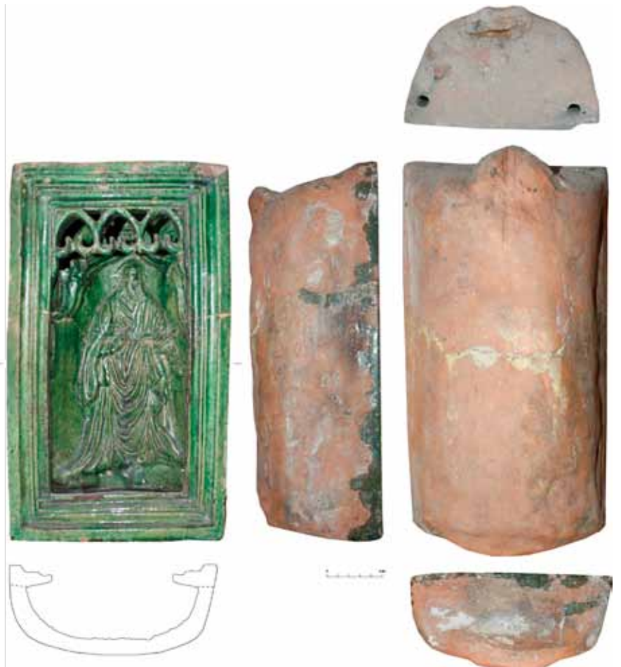
Abb. 3. Die Nischenkachel mit Motiv 1.