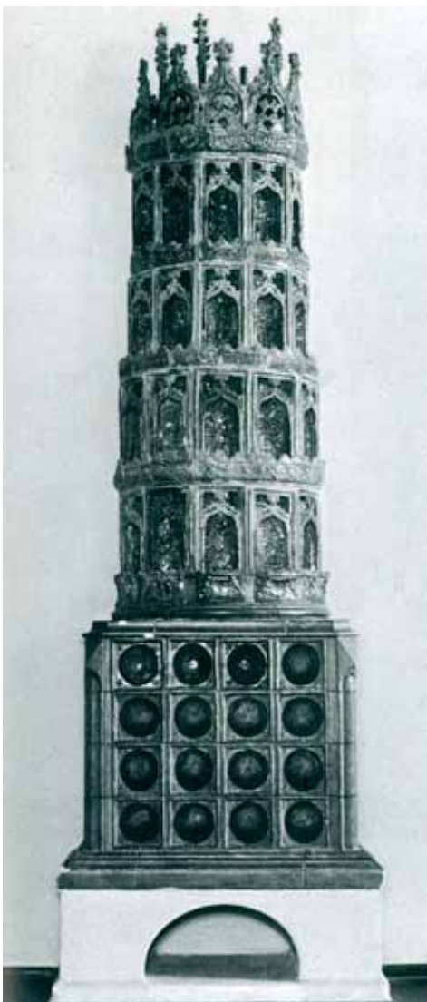
Fig. 6. Reconstruction of a stove with half-cylinder tiles, dating 1473, Museum of Applied Arts, Dresden (from FRANZ 1981 fig. 102).

Abb. 6. Rekonstruktion eines Ofens mit Nischenkacheln von 1473, Museum für Kunsthandwerk, Dresden (nach FRANZ 1981 Abb. 102).